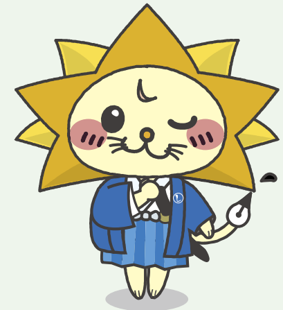
日司連公式キャラクター「しほ〜しし」